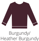
Burgundy/ Heather Burgundy